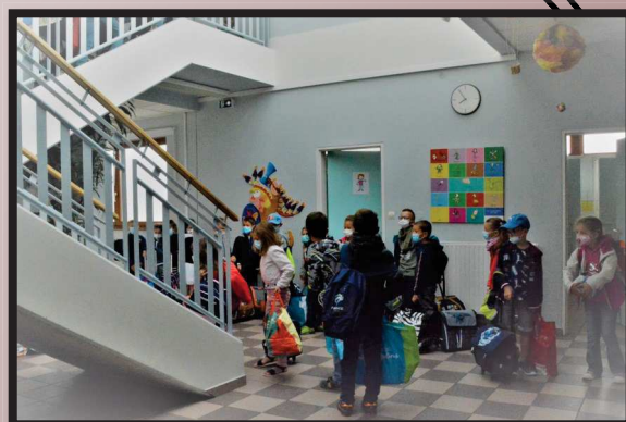
Rentrée Scolaire 2021-2022