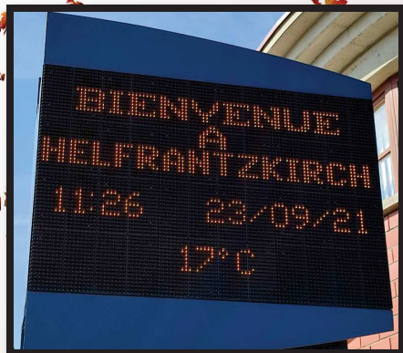
Panneau d'affichage électronique