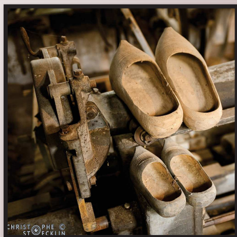
Journée du Patrimoine