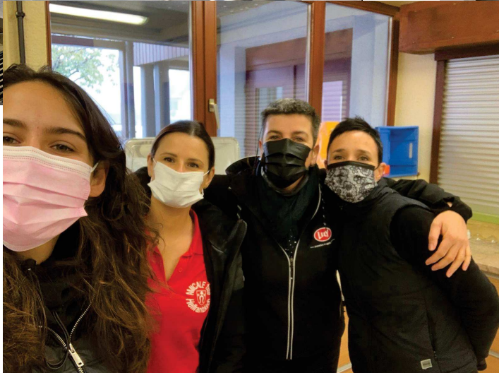
© Amicale du corps et de la musique Des sapeurs-pompiers