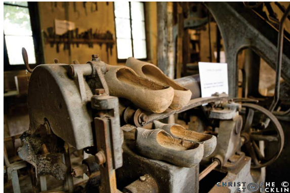
© Christophe STOECKLIN / André KOPFHAMMER