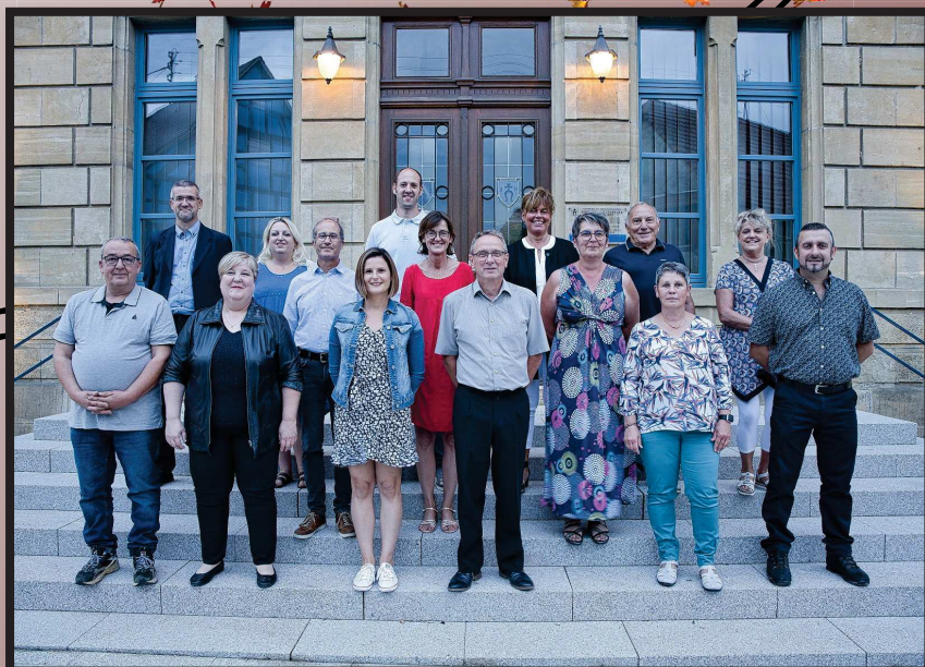
Le Conseil Municipal